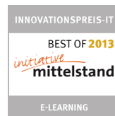
..... Best of Innovationspreis IT 2013