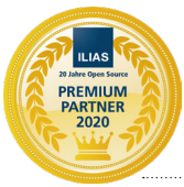
..... ILIAS Premium-Partner

Auch unsere Auszeichnungen geben Ihnen die Gewissheit: Wir sind ein guter Partner.