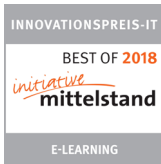
..... Best of Innovationspreis IT 2018