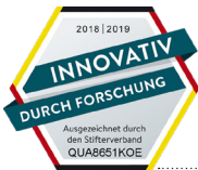
..... Forschung und Entwicklung 2018