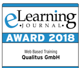
..... eLearning AWARD 2018