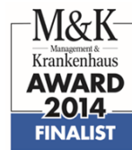
..... Finalist M&K-Award 2014