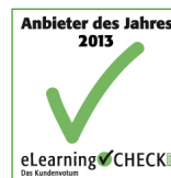
..... Anbieter des Jahres 2013